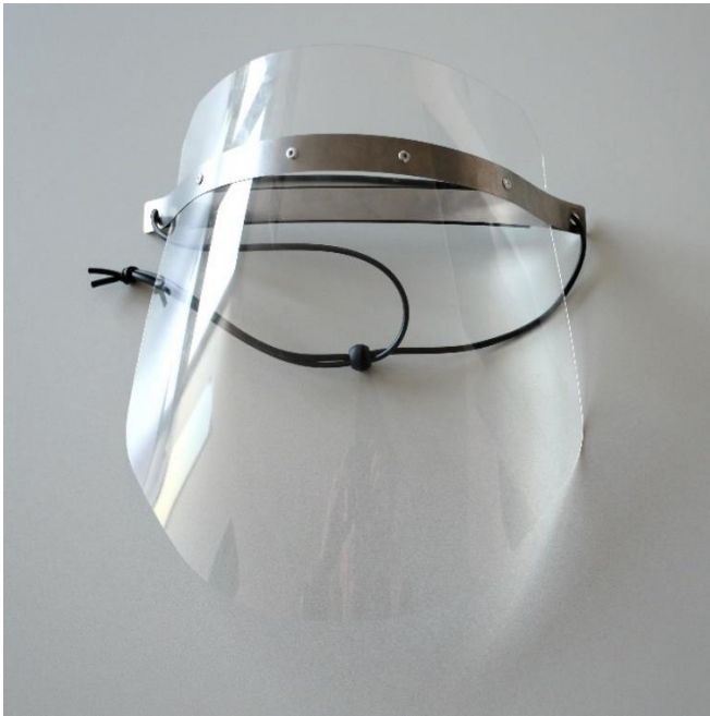
Vollgesichtsvisier | Rückseite